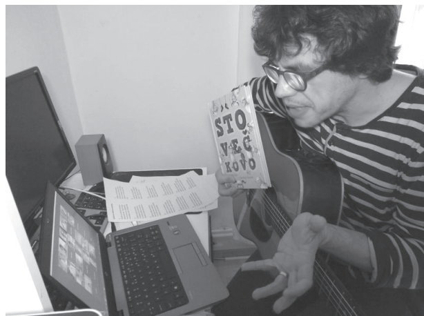
Online beseda s pesničkárom Mirom Jilom