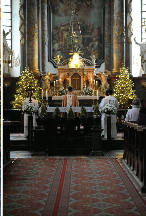
Vianočné bohoslužby v piaristickom kostole s protipandemickými opatreniami, december 2021