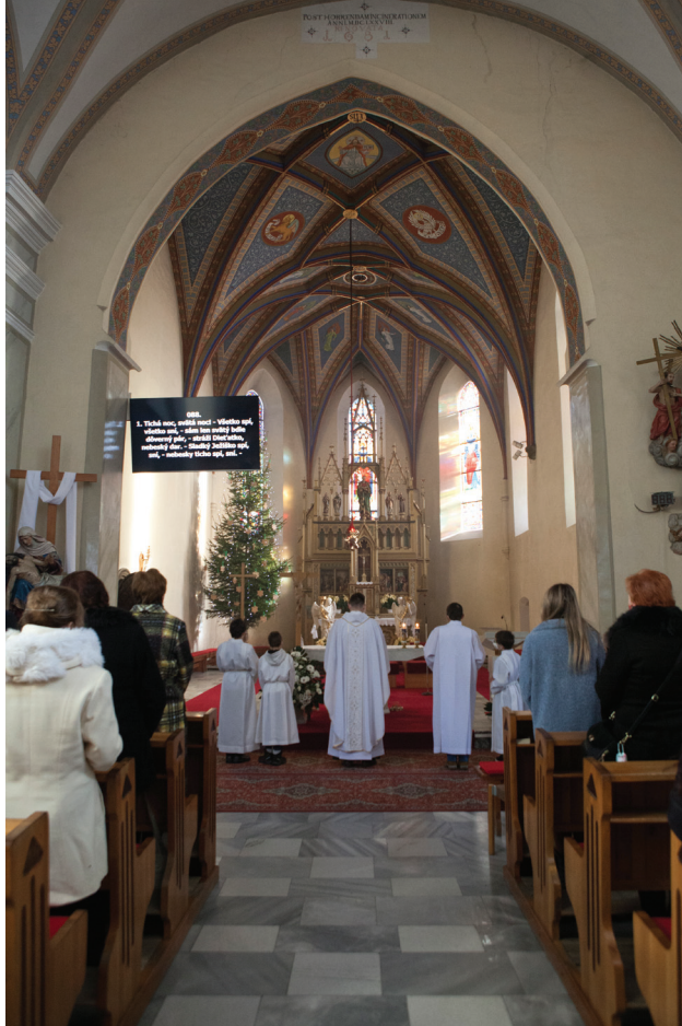
Vianočné bohoslužby vo farskom kostole počas druhého roku pandémie, december 2021