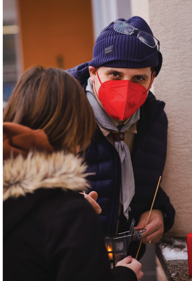
Betlehenské svetlo roznášali skauti v Prievidzi od 22. do 24. decembra 2021